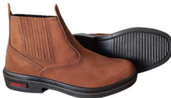
Botina Thorxx Elástico Marrom