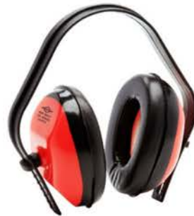
Abafador de Ruídos