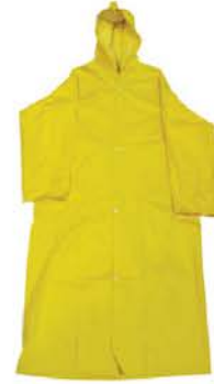
Capa Chuva Pvc Amarela Policap