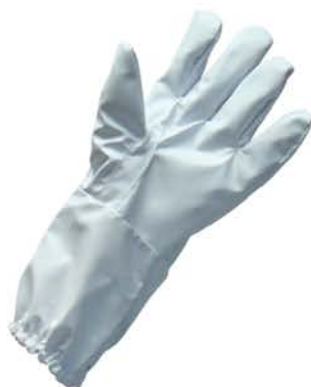
Luva P/ Apicultura Napa