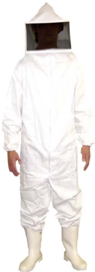
Macacão Compl. P/Apicultura Algodão