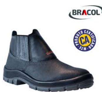
Botina De Segurança Bidensidade Kadesh Flex