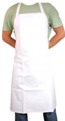
Avental Pvc C/Forro Branco C/Engate 120Cm