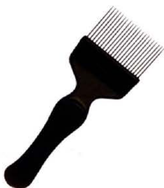
Garfo Desoperculador Cabo Plast