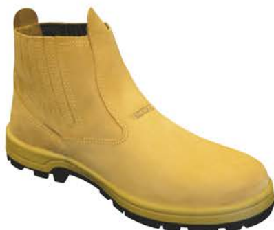
Botina Thorxx Elástico Caramelo