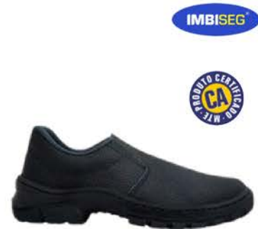
Sapato De Segurança Monodensidade