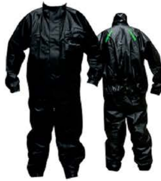
Conj. P/Motoqueiro Policap Preto Forrado