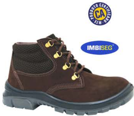
Botina De Segurança Bidensidade Nobuck