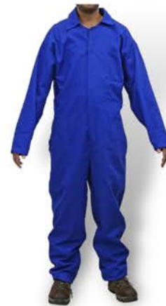
Macacão Industrial Azul Manga Longa