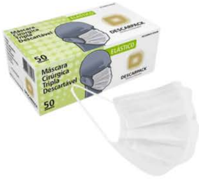
Máscara Desc. Tripla Branca Cx 50Und