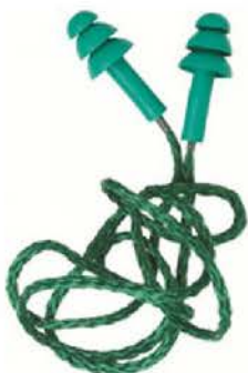
Protetor Auditivo Polimer C/ Corda Sachê