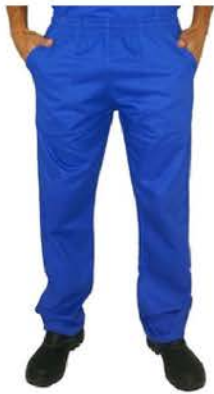
Calça Industrial Azul