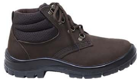
Botina Nobuck 3G PU Marrom