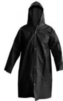
Capa Chuva Pvc Forrado Preta Ecopoli