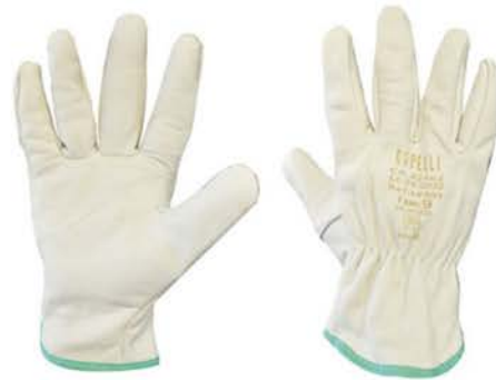
Luva Vaqueta Natural c/ Elastico C/C