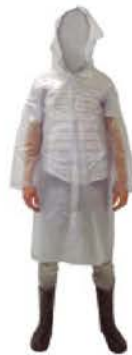
Capa Chuva Pvc S/Forro Higienizavel Transp.