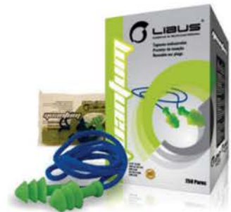
Protetor Auditivo Libus Quantum c/ Corda