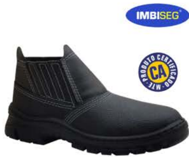
Botina Segurança Solado Pu Mono