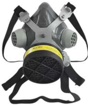
Respirador 1/4 Facial Mastt 2001-Vo