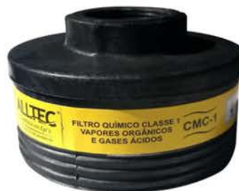
Filtro Químico - Vo Para Respiradores Mastt