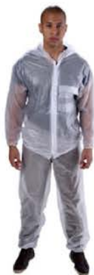
Conj. P/Motoqueiro Vinil Transp. Policap S/Forro