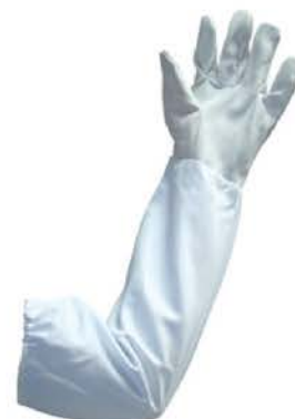
Luva P/ Apicultura Vaqueta/Brim C/ Longo