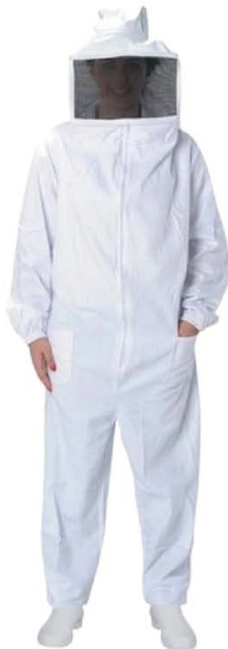
Macacão Compl. P/Apicultura Nylon Ventilado