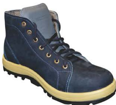
Botina Thorxx Brb Azul