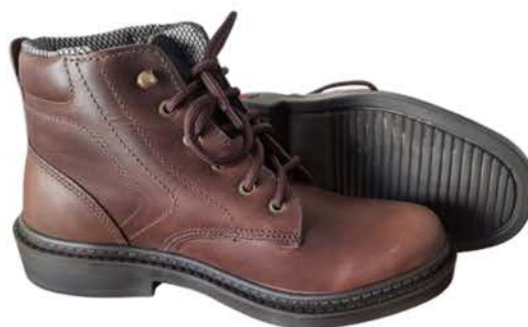
Botina Thorxx Cadarço Crazy Horse