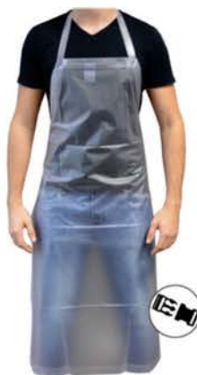
Avental Pvc Vinil S/Forro Transparente 120Cm