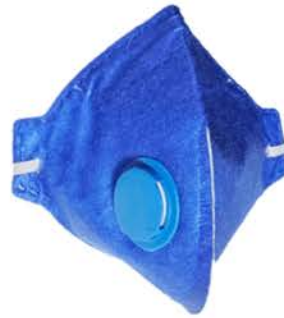
Respirador VI C/ Valvula PFF-2