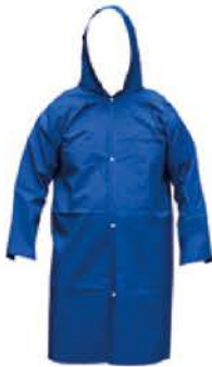
Capa Chuva Pvc Forrada Azul Policap