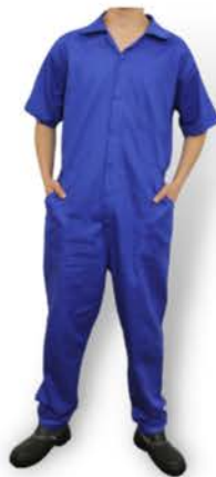
Macacão Industrial Azul Manga Curta