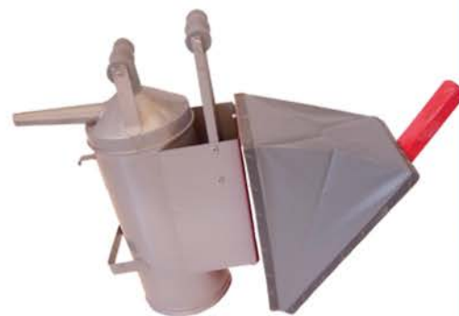
Fumigador Zatti P/Apicultura