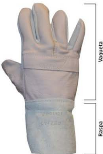
Luva Vaqueta Mista- Vaqueta/Raspa