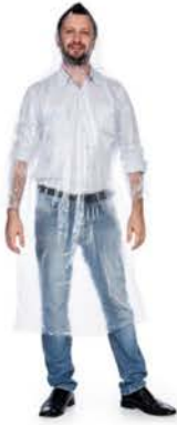
Capa Chuva Descartável (0,72M X 1,42M)